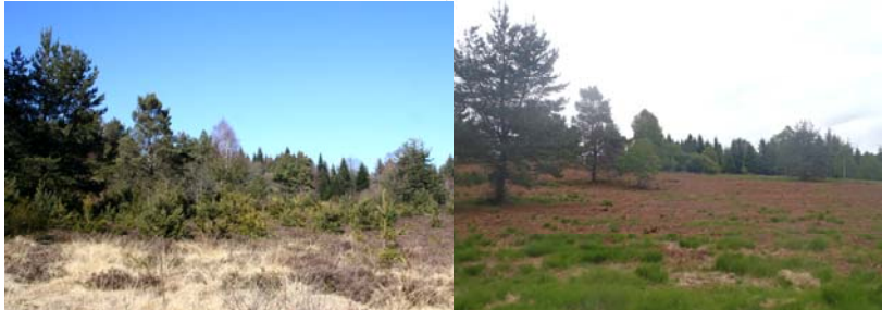
2010 : un fourré de Pins... 2011 : une lande sèche restaurée !

Vous découvrirez ci-dessous en images comment cet outil Natura 2000 a permis de ré-ouvrir un ensemble de 31 ha de tourbières et de 8 ha de landes sèches gérés par un élevage extensif.