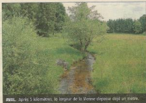
AVAL. Après 5 kilomètres, la largeur de la Vienne dépasse déjà un mètre.

La qualité de ses milieux aquatiques permet à la Vienne d'accueillir de nombreuses espèces et une végétation en excellent état de conservation.